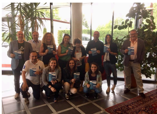
14 Junio 14 de 2018, meeting final en Graz

El proyecto "DREAM: Refuerzo dinámico para la adaptación europea de los migrantes" tiene el objetivo de reforzar la oferta dirigida a la integración de migrantes, mediante el intercambio de experiencias en áreas de integración prioritarias y difundir los resultados de iniciativas de éxito a través de una red de partes interesadas de toda la UE.